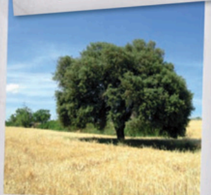
Alzina de Can Coniller