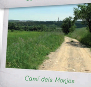
Camí dels Monjos