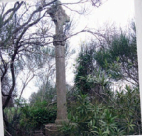
Creu de la finca de Can Badiella