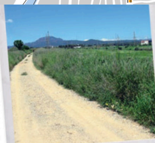
Camí vell de Sant Quirze a Matadepera