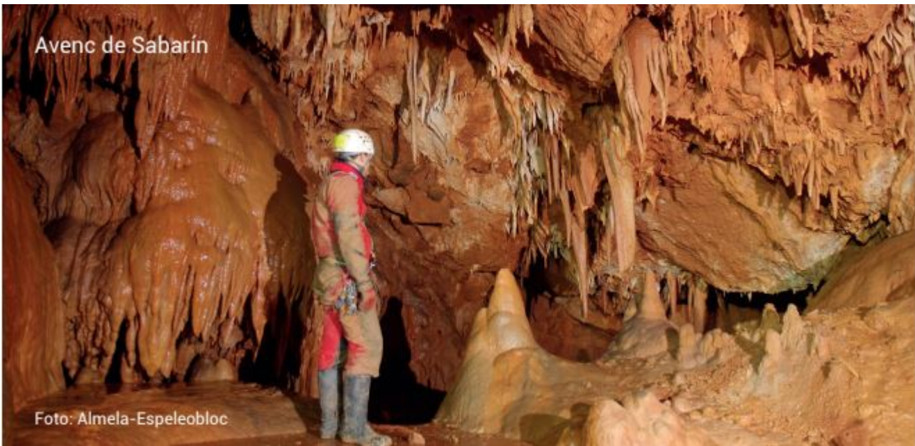
Avenc de Sabarin