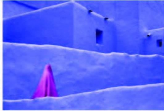
«Passejant», fotografia de Santi Viladrich Concurs fotogràfic LXXIX